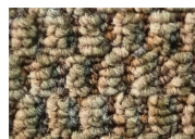
Energizer Ready 846