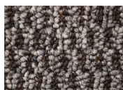
Zoom In 968