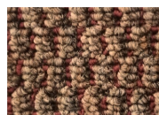
Buzz Worthy 862