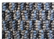
Power Surge 579