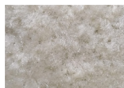
Garlic Power 721